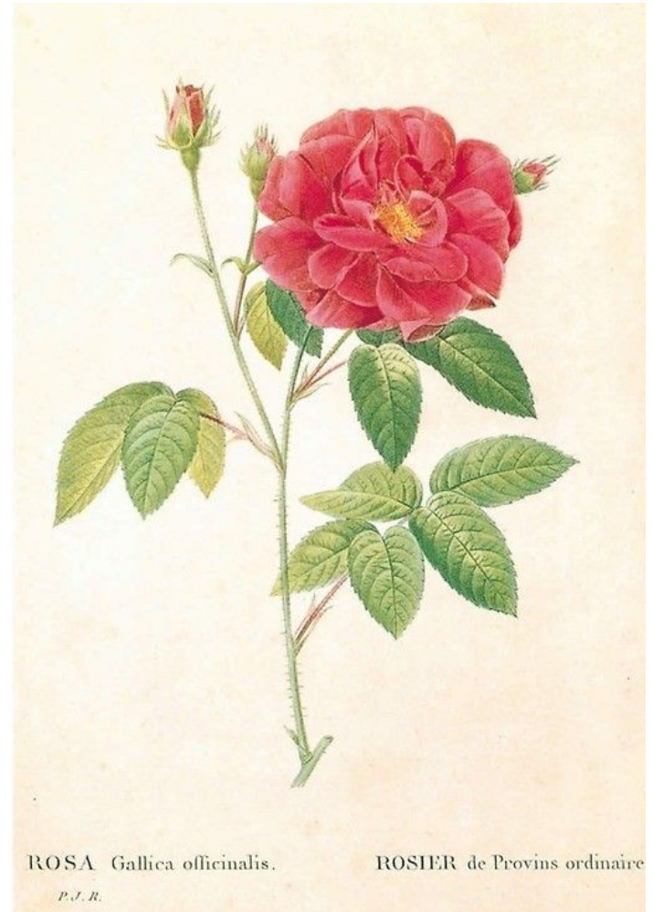
ROSA Gallica officinalis.